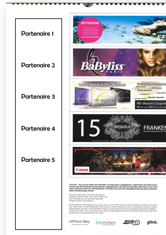
Un bon «promo» en dernière page